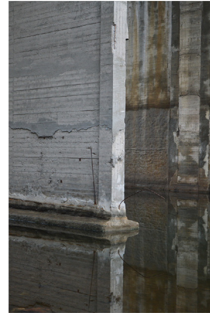
VYBRANÉ FOTOGRAFIE Z VOJSLAVICKÉHO MOSTU