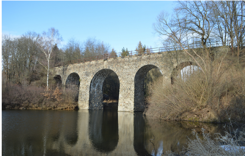
UKÁZKA Z ŽELEZNIČNÍHO VIADUKTU V NĚMČICÍCH