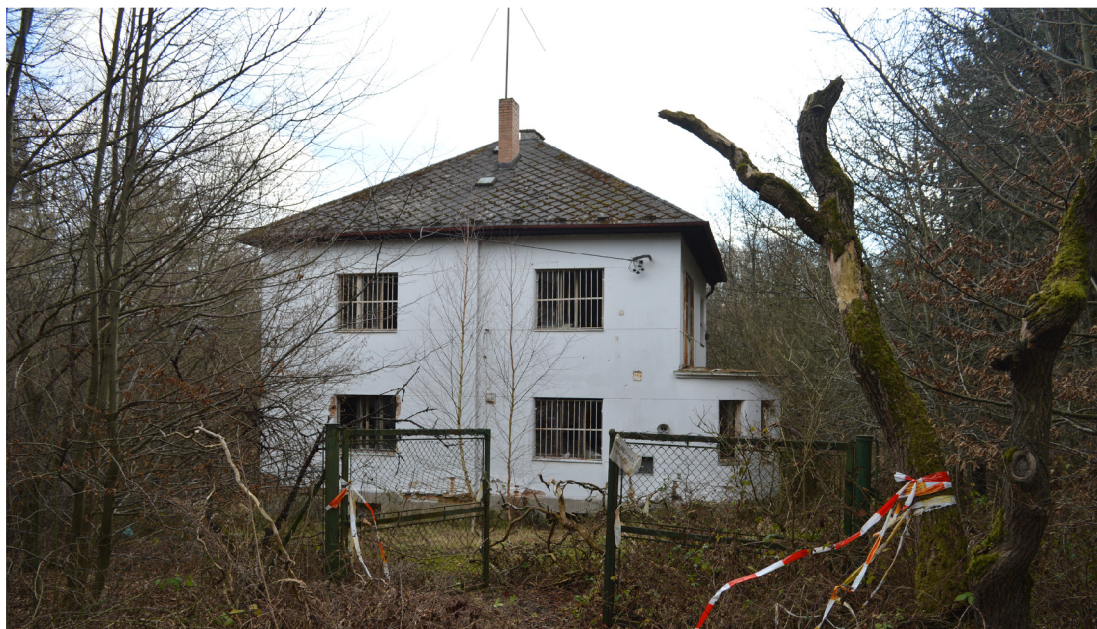
UKÁZKA Z OPUŠTĚNÉ VILY VE "STARÝCH" DOLNÍCH KRALOVICÍCH