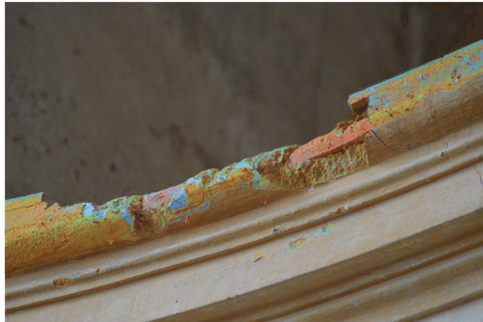
UKÁZKA ZKOUŠKY POSTPRODUKCE VE PHOTOSHOPU