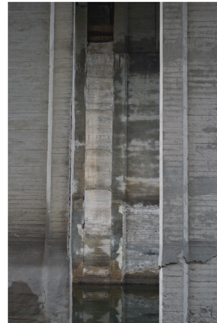
VYBRANÉ FOTOGRAFIE Z VOJSLAVICKÉHO MOSTU