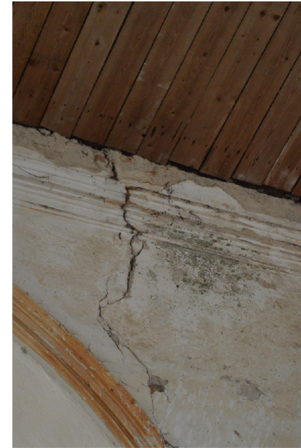
VYBRANÉ FOTOGRAFIE Z KOSTELA SV. PETRA A PAVLA