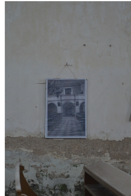
VYBRANÉ FOTOGRAFIE Z KOSTELA SV. PETRA A PAVLA