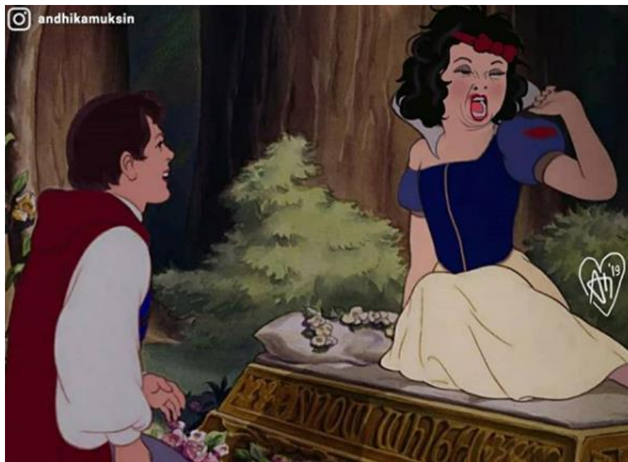
Jak podle umělce mělo vypadat ve skutečnosti probuzení Sněhurky. 135

V dnešní době jsou velmi populární také meme obrázky. Například umělec Andhika Muksin na svůj instagramový profil sdílí meme obrázky, jak by některé scény z pohádek vypadaly ve skutečnosti nebo propojuje animované osoby se současností. Často postavy zasazuje do úplně jiných filmů. Jeho tvorba je velmi populární a na Instagramu ho sleduje přes 450 000 lidí. 134