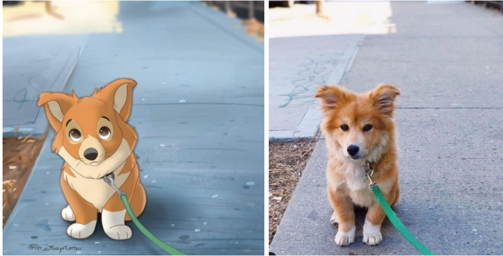
Překreslená fotografie opuštěného psa. 133

V dnešní době jsou velmi populární také meme obrázky. Například umělec Andhika Muksin na svůj instagramový profil sdílí meme obrázky, jak by některé scény z pohádek vypadaly ve skutečnosti nebo propojuje animované osoby se současností. Často postavy zasazuje do úplně jiných filmů. Jeho tvorba je velmi populární a na Instagramu ho sleduje přes 450 000 lidí. 134