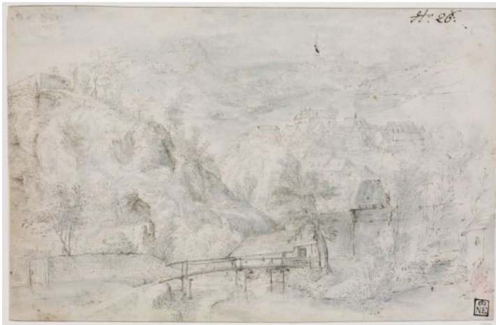
Beeld 1 Rivierlandschap met burg