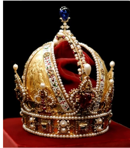
Beeld 8: De Rudolfinische keizerskroon