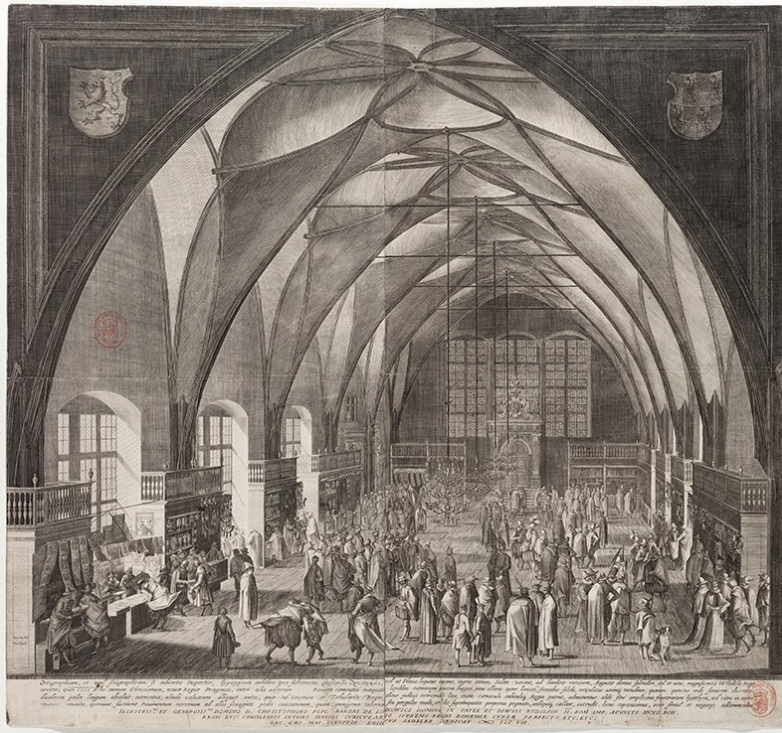
Beeld 3: De Wladislaw zaal (1607)