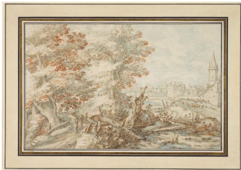
beeld 2 - Een bebost landschap met reizigers bij een beek en een stad voorbij (1597)