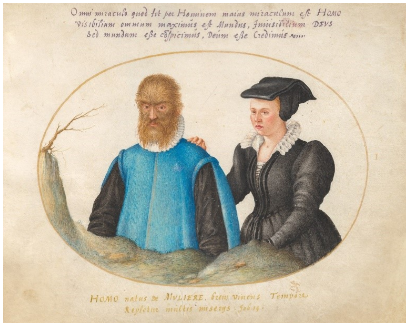
Beeld 4: Animalia Rationalia et Insecta (Ignis): Plate I