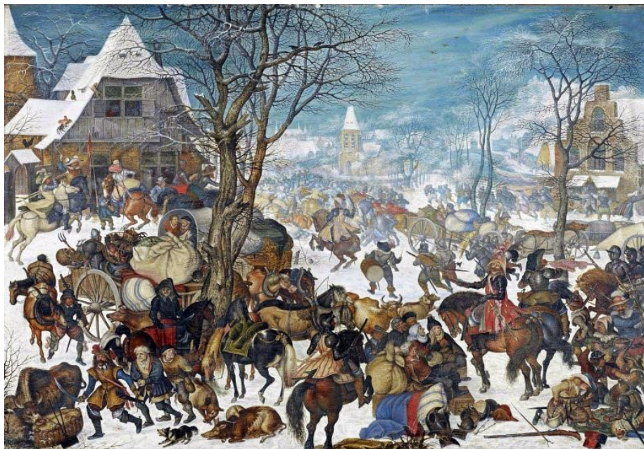
Beeld 6: Plundering van een dorp (1604)