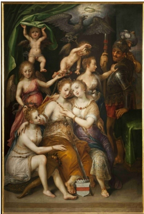
Beeld 2- Alegorie aan de regering van de keizer Rudolf II (1603).