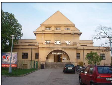
Obrázek 3. Sokolovna - zepředu