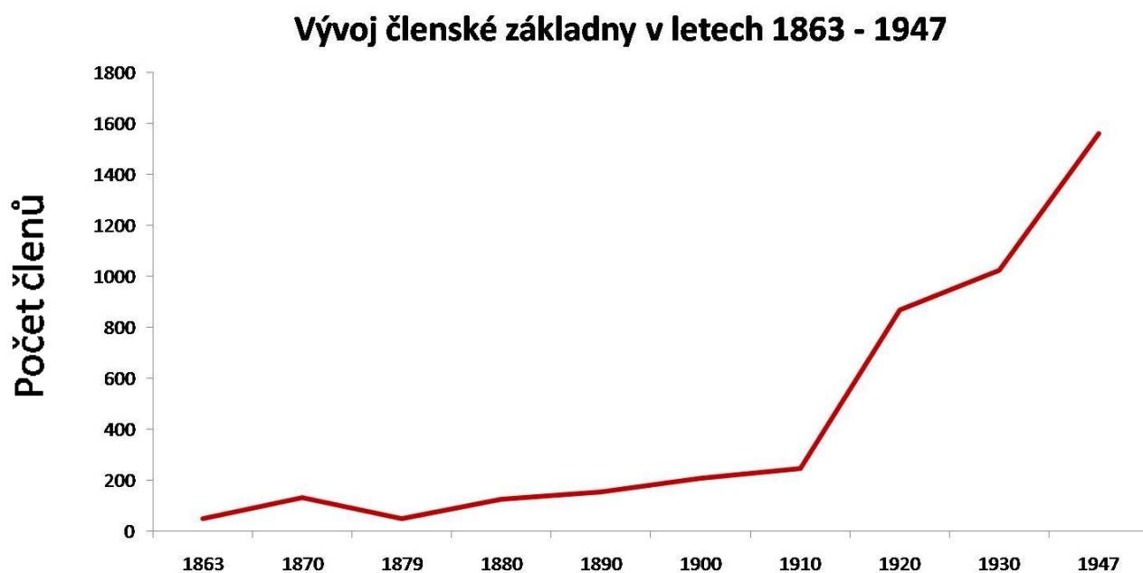
Obrázek 1. Křivka vývoje členské základny T. J. Sokol Pardubice 1 od roku 1863 do roku 1947