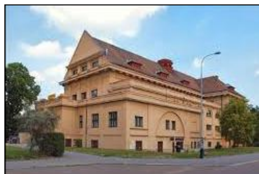
Obrázek 4. Sokolovna - pohled z boku